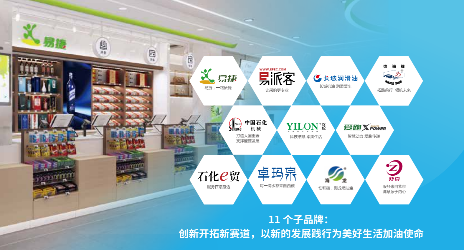
11 个子品牌： 创新开拓新赛道，以新的发展践行为美好生活加油使命